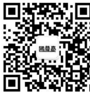
北京市长江科技扶贫基金会