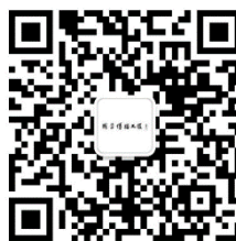
国学传播工程工作人员微信